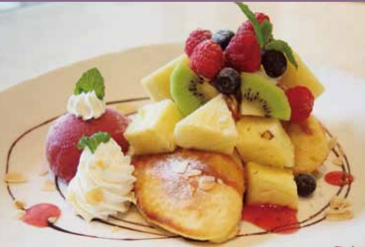
◀ふわふわフルーツパンケーキ ¥880

フルーツをたっぷりデコレーションしたシェフ自慢のフワフワパンケーキ。ほんのり懐かしい甘さのパンケーキは、誰もが大好きなスイーツ。フルーツティーと一緒にどうぞ♪