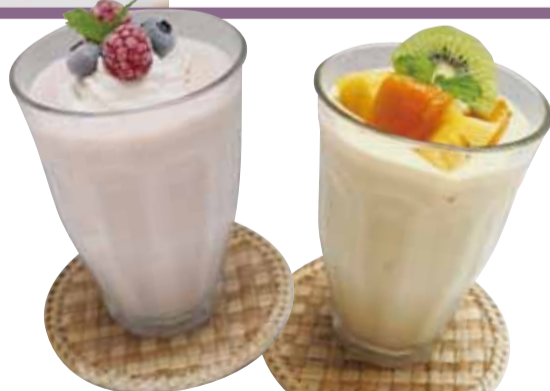
●ベリースムージー ●マンゴースムージー 各¥540

今流行のフレーバーウォーター。海外のホテルやレストランでは、フルーツやハーブを入れたフレーバーウォーターがブームです。この夏セーヌでは無料試飲サービスを開催中です!ぜひご利用ください。