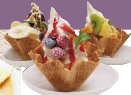
▲フルーツのミニパルフェ 各¥540 (バナナチョコレート/ベリー/マンゴー)