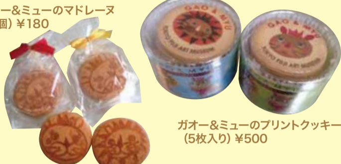
ガオー&ミューのプリントクッキー (5枚入り) ¥500