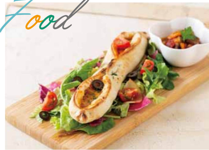
ソレントピッツァ(トマト煮付き) ¥880

本場イタリアから輸入のピッツァを、サニーレタス、水菜、紅芯大根、 ミニトマト、オリーブと合わせてサラダ風に仕立てました。