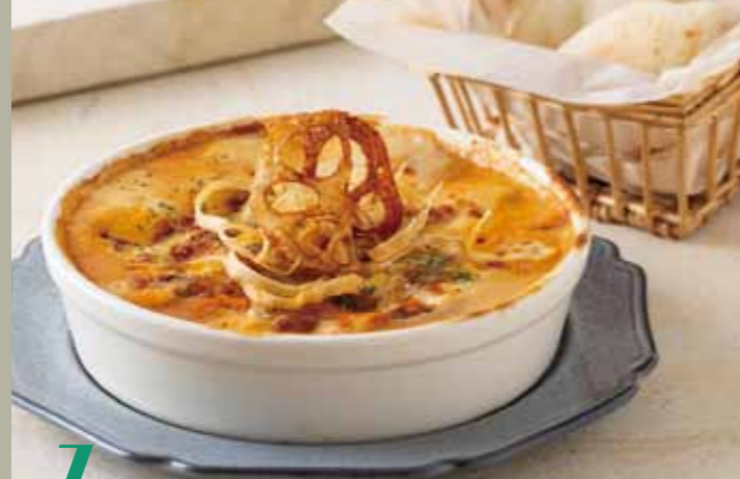
b セーヌ特製ラザニア(フォカッチャ付き) 単品 ¥970 セーヌ風ラザニアが新登場! グラタンソース、ミ ートソース、ナスとチーズが入ったラザニアです。