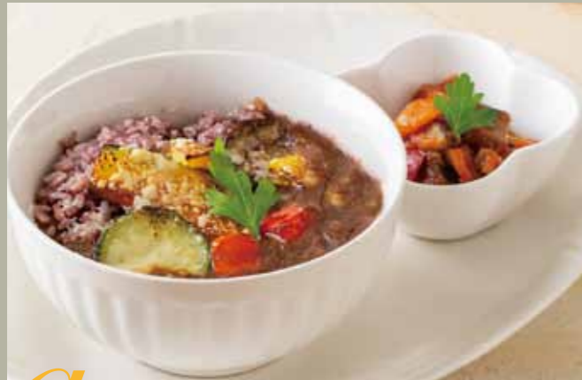
a 焼き野菜カレー(トマト煮付き) 単品 ¥970 パプリカ、ナス、ズッキーニ、かぼちゃとチーズを のせて焼いたセーヌ人気の焼き野菜カレーです。