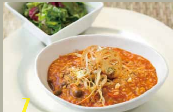
d トマトリゾット(ミニサラダ付き) 単品 ¥880 パプリカ、ズッキーニ、ナスの夏野菜とトマト ソースで合わせたセーヌ風のリゾットです。