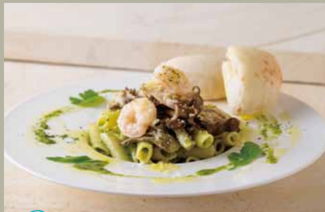
c 海老ときのこのジェノベーゼペンネ (フォカッチャ付き) 単品 ¥970 ジェノベーゼソースでからめたペンネに、海老とチーズ をかけて焼いた舞茸、しめじを盛り合わせました。