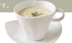
冷製コーンスープ ¥380