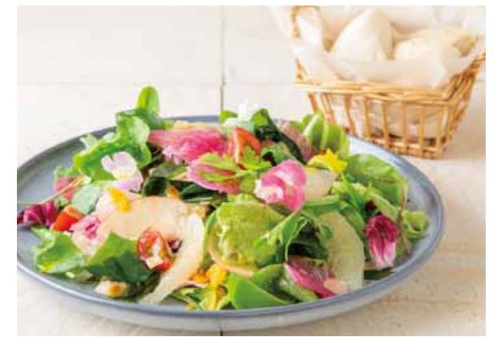
彩野菜とフルーツのサラダ(フォカッチャ付き) ¥980

本場イタリアから輸入のピッツァを、サニーレタス、水菜、紅芯大根、 ミニトマト、オリーブと合わせてサラダ風に仕立てました。