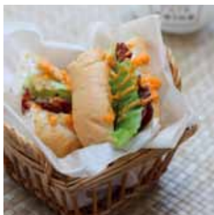
パストラミビーフサンド or ツナサンド (本日のスープ付き) 各 ¥630 サンドイッチとスープが ついたお得なセットで す。パストラミビーフサ ンドとツナサンドからお 選びいただけます。