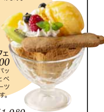
フルーツミニパルフェ ¥500

キラキラの器にマンゴー&パ ッションフルーツのアイスとベ リー、パイン、キウイのフル ーツがのった爽やかなパル フェです。