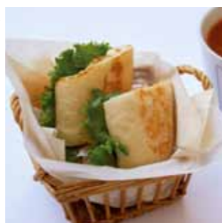
パニーニサンド (本日のスープ付き) ¥630 もちもちした食感のバ ニーニに、ハムとチー ズ、レタスをはさんだサ ンドイッチとスープの セットです。